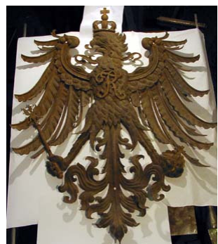
Preußischer Adler vor der Restaurierung und danach